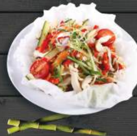
05. NỘM GÀ 120gr 79 Kč

Tuňákový salát s avokádem, sojovou omáčkou a wasabi ( A: 4 ) Tuna salad with avocado