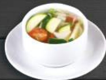
111. SÚP RAU NẤU ME 200ml 49 Kč Zeleninová polévka s kyselým tamarindem Vegetable soup with tamarine