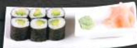
205. AVO SESAME MAKI 6ks 89 Kč Avokádo, sezam (A: 4, 6) Avocado and sesame