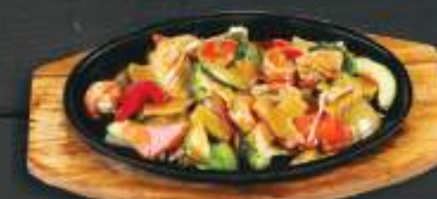
93. HÀI SÀN BÀN GANG 200gr 269 Kč Krevety a kalamáry se zeleninou a houbami na ústřicové omáčce (A:2) Prawn and calamari with oyster sauce and champignon