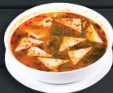
48. BÚN ĐẬU PHỤ THÁI 700ml 149 Kč Thajská polévka s rýžovými nudlemi a tofu (A:14) Thai noodle soup with tofu