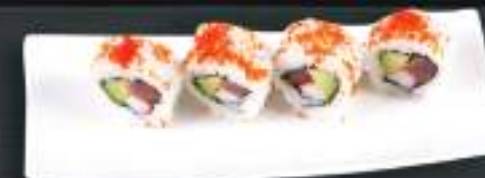
241. HOT SPICY TUNA ROLL 139 Kč Pikantní tuňák, avokádo, okurka, kaviár (A: 4, 6) Tuna, avocado, cucumber, caviar