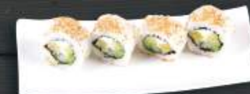
245. BUDDHA ROLL 119 Kč Avokádo, okurka, ředkev, krémový sýr (A: 6, 7) Avocado, cucumber, creamy cheese, radish