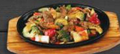
92. VỊT KUNGPAO BÀN GANG 200gr 269 Kč Kung Pao z kachny servírované na horkém litinovém talíři (A: 6, 8) Duck meat kung pao on sizzling plate