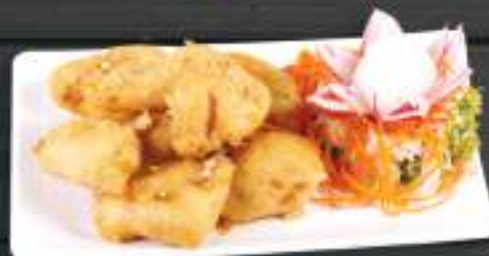
122. ÚC GÀ TÂM BỘT 120gr 119 Kč Obalené kuřecí kousky, smažené do křupava Crispy deep fried chicken