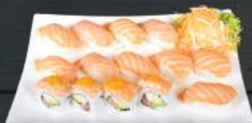
279. SUSHI MENU 9 629 Kč

Hot spicy Tuna Roll (4ks) Futo Maki Vegetarian (6ks) Tekka Maki (6ks) Buddha Roll (4ks) (A: 2, 4, 6)