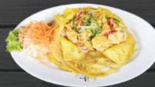
89. PATHAY GÀ 150gr 159 Kč Kuřecí Pad Thai: thajské rýžové nudle smažené s vejcem, dochucené pikantní sladko-kyselou omáčkou (A:3) Chicken pad thai ( thai fried noodle with chicken and sweet sour sauce)