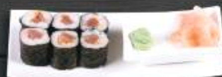
203. HOT SPICY TUNA 6ks 99 Kč Tuňák s pikantní omáčkou (A: 4, 6) Tuna with spicy sauce