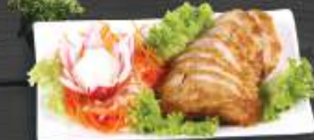
23. ĐÙI GÀ QUAY 119 Kč Pečené kurčecí stehýnko se sezamem a zeleninou (A: 11) Grilled chicken thigh with sesame