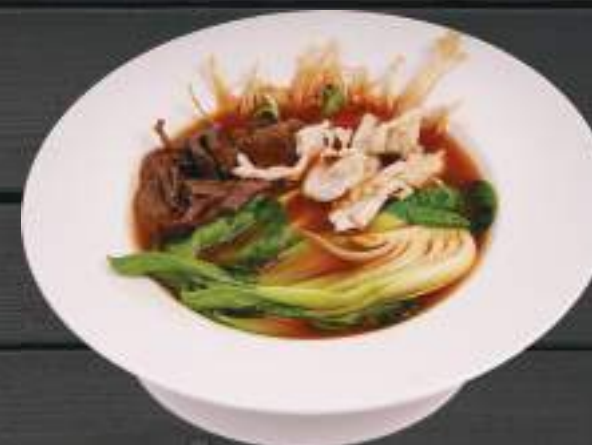
155. UDON 700ml 179 Kč Vařené japonské nudle s hovězím/kuřecím masem (A:6) Udon noodles with pork and chicken meat