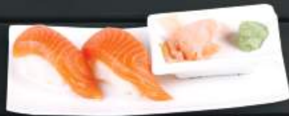
220. SAKE NIGIRI 2ks 99 Kč Losos (A:4,6) Salmon