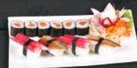
272. SUSHI MENU 2 359 Kč Maki Sake (6 ks), Nigiri Unagi (2 ks), Surimi Nigiri (2ks) (A: 4, 6)