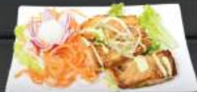
21. CÁ HÒI NƯƠNG 129 Kč Grilovaný losos (A: 4, 6) Grilled salmon with teriyaki sauce