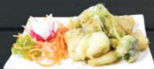
112. RAU QUẢ TẨM BỘT CHIÊN GIA VỊ 200g 99 Kč Brokolice, žampiony, cuketa obalená ve specialní strouhance Deep fried vegetables