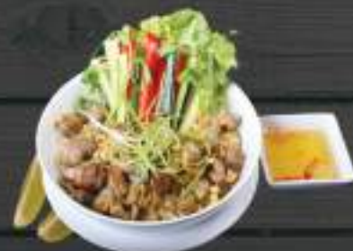
38. BÚN VỊT NƯỚNG 150gr 169 Kč Tenké rýžové nudle s pečeným kachním masem (A:2) Thin noodles with grilled duck meat