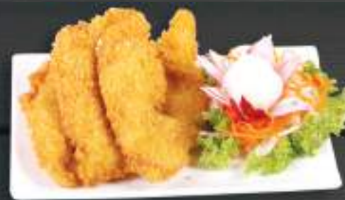
121. GÀ CHIÊN XÙ 120gr 119 Kč Kuřecí kousky v těstíčku (A: 1) Crispy fried chicken