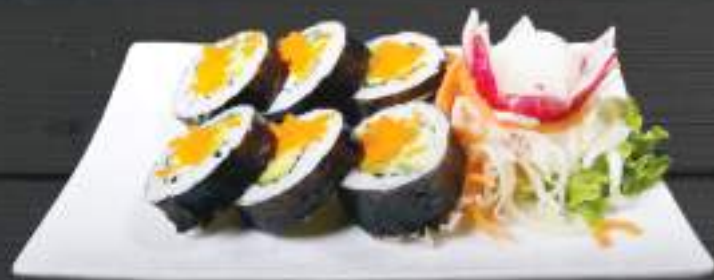
215. FUTO MAKI VEGETIRIAN 6ks 129 Kč Losos, avokádo, okurka, kaviár (A: 4, 6, 7) Salmon, avocado, cucumber and caviar