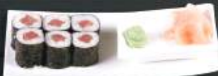
202. TEKKA MAKI 6ks 99 Kč Tuňák (A: 4, 6) Tuna