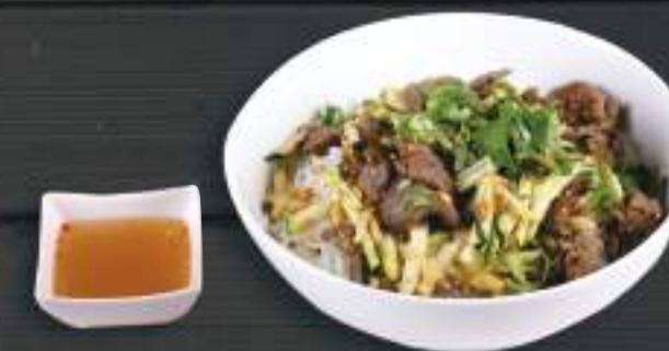
44. BÚN BÒ NAM BỘ 150gr 179 Kč Tenké rýžové nudle s hovězím masem Noodle with stir-fried beef & salad