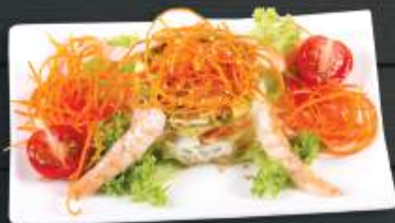
03. TÔM COCKTAIL 120gr 89 Kč

Krevetový salát s avokádem a Coctail omáčkou (A: 2,6) Prawn cocktail salad with avocado