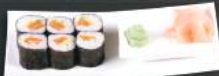
201. SAKE AVO MAKI 6ks 99 Kč Losos, avokádo (A: 4, 6) Salmon and avocado