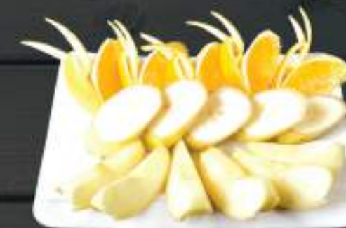
127. HOA QUẢ THẬP CẨM 69 Kč Čerstvé ovoce Mixed fresh fruits