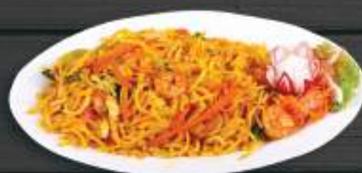
86. MỠ XÀO TÔM, THÁI 150gr 169 Kč Smažené nudle na thajském kari s krevetami (A:2) Thai fried noodle with prawn