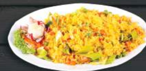
116. CƠM CHIÊN RAU 250g 119 Kč Smažená rýže se zeleninou a vejcem (A:3) Fried rice with vegetables