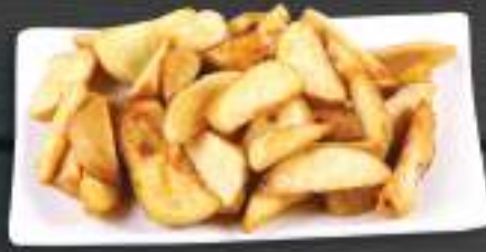
102. KHOAI TÂY CHIÊN 150gr 45 Kč Americké brambory Potatoes wedges