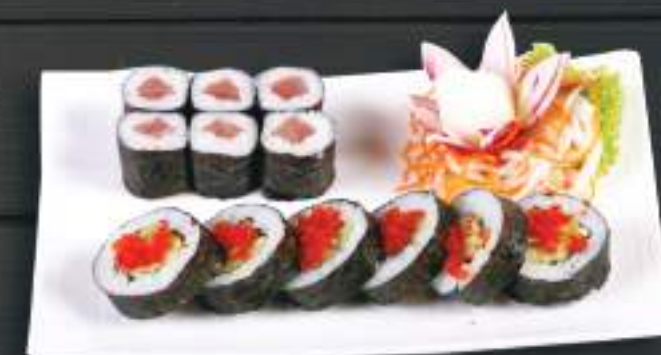
211. TUŇÁK MAKI ( 6KS ) FUTO SAKE ( 6KS ) 199 Kč (A: 4,6,7)