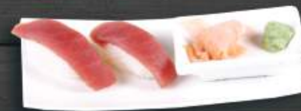
225. MAGURO NIGIRI 2ks 119 Kč Tuňák (A: 4, 6) Tuna