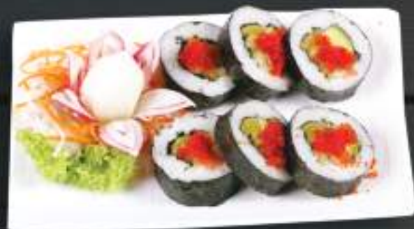
216. FUTO MAKI SAKE AVO 6ks 199 Kč Avokádo, okurka, kaviár, nakládaná ředkev (A:6) Avocado, cucumber, caviar and radish