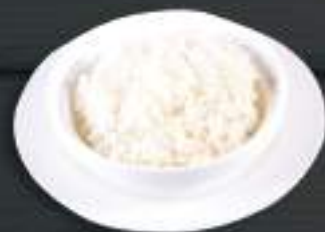
103. CƠM TRẮNG 150gr 39 Kč Rýže (bílá, dušená) Plain white rice