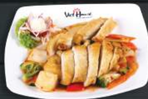
52. GÀ TÔI CAY 150gr 169 Kč Pikantní kuře s česnekem (A:1,6) Chicken sweet and sour with garlic