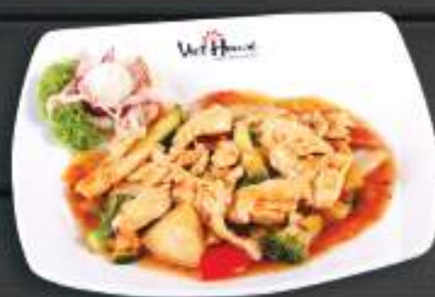
51. GÀ XÀO SÀ ỚT 150gr 169 Kč Pikantní kuře s citronovou trávou (A:6) Sweet and sour chicken