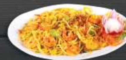
34. MÌ XÀO TÔM 159 Kč Smažené nudle s krevetami (A: 2, 3) Fried noodle with prawn