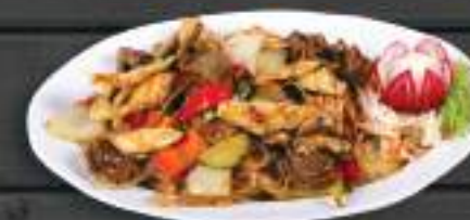
32. PHỞ XÀO THẬP CẨM 169 Kč Smažené rýžové nudle se třemi druhy masa (kuřecí, vepřové, hovězí) (A:3) Fried rice noodle with mixed meat (chicken, pork, beef)