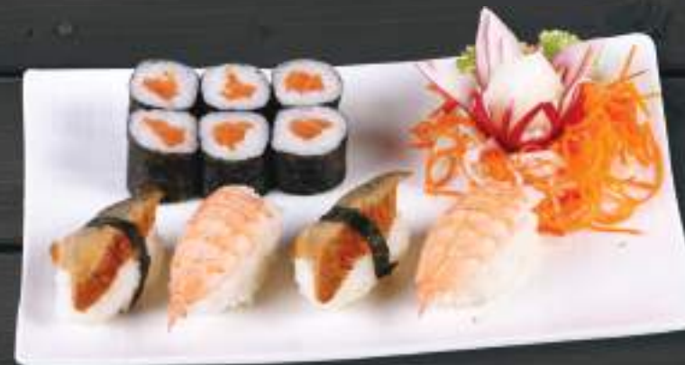
230. SAKE MAKI (6KS) EBI NIGIRI, UNAGI NIGIRI 279 Kč Losos, hokkigai nigiri, uze ný úhoř (A: 4, 6) Salmon, prawn, eel