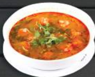
49. BÚN TÔM THÁI 700ml 169 Kč Thajská polévka s rýžovými nudlemi a krevety Thai noodle soup with prawn