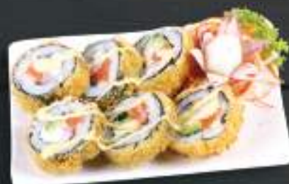
244. VIET HOUSE ROLL 179 Kč Losos, avokádo, krémový sýr, krab (A: 2, 4, 6, 7) Salmon, avocado, creamy cheese, crab