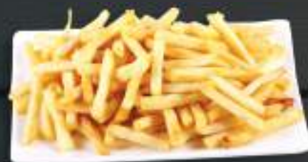
101. KHOAI TÂY CHIÊN 150gr 45 Kč Hranolky French fries