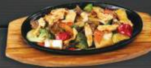
90. 3 LOẠI THỊT HOISIN BÀN GANG 200gr 269 Kč Restované kuřecí, vepřové a hovězí maso se zeleninou a Hoisin omáčkou (A:6) Mixed 3 meats with vegetables in hoisin sauce (pork, beef, chicken)