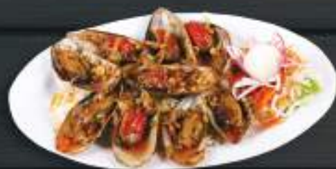
26. NGHÊU NƯỚNG 200gr 249 Kč Grilované škeble polité pikantní omáčkou (A: 6, 14) Clam bake