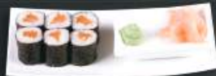
200. SAKE MAKI 6ks 99 Kč Losos (A:4,6) Salmon