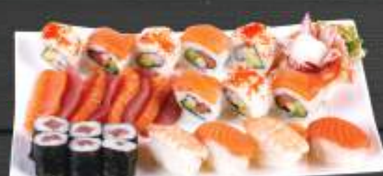
280. SUSHI MENU 10 950 Kč

Sake nigiri (10ks), Losos-Lachs, Rain Bow Roollsy (4ks) (A: 2, 4, 6)