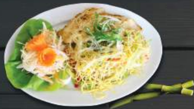
151. MIÉN TRỘN 150gr 179 Kč Vařené skleněné nudle s akuřecim/hovězím/krevetami (A:2,3) Mixed glass noodle with chicken and prawn