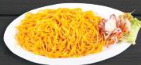
104. MÌ XÀO TRỨNG 150gr 69 Kč Smažené nudle s vejcem Fried noodles with eggs