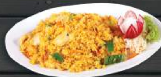
87. CƠM RANG GÀ THÁI 150gr 159 Kč Smažená rýže na thajském kari s kuřecím masem Thai fried rice with chicken meat