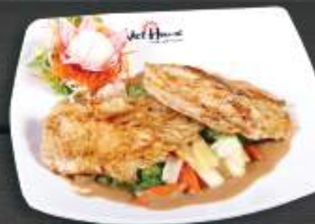
54. GÀ NƯỚNG SÓT LẠC 150gr 169 Kč Grilované kuřecí maso s arašidovou omáčkou (A:6) Grilled chicken meat with peanut sauce