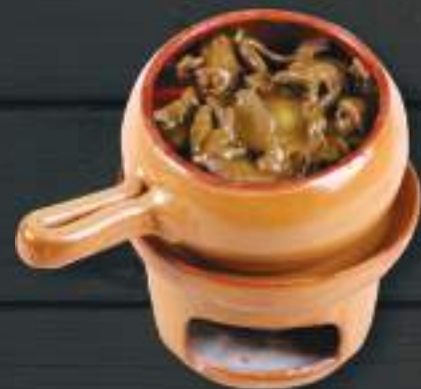
84. BÒ CÀ RI OM 150gr 269 Kč Thajské hovězí maso v keramickém hrnci s cibulí a cuketou na kari omáčce (A: 1, 7) Thai beef meat with curry sauce