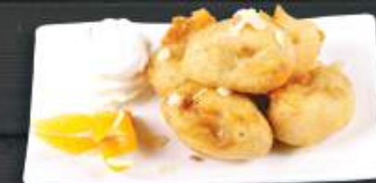
128. CHUÔI CHIÊN 5ks 69 Kč Smažený banán v těstíčku s medem a mandlemi (A: 1, 8) Fried banana with honey and nuts