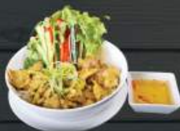
39. BÚN THỊT NƯỚNG 150gr 159 Kč Tenké rýžové nudle s grilovaným vepřovým masem a pikantní sladkokyselou omáčkou (A:6) Noodles with grilled pork with sweet and sour sauce