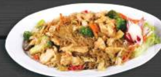
42. MIẾN XÀO GÀ 150gr 159 Kč Smažené skleněné nudle s kuřecím masem (A:3) Fried glass noodles with chicken meat