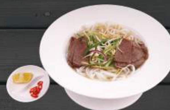
30. PHỞ BÒ HÀ NỘI 129 Kč Hanojská hovězí polévka s rýžovými nudlemi Traditional Beef Pho Bo noodle soup