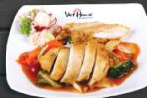
56. GÀ CHUA NGỌT 150gr 169 Kč Pečená kuřecí prsíčka na sladkokyselé omáčce (A:6) Roast chicken with sweet and sour sauce