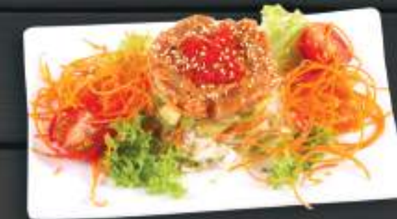
04. SALAD CÁ NGỪ 120gr 119 Kč

Tuňákový salát s avokádem, sojovou omáčkou a wasabi ( A: 4 ) Tuna salad with avocado