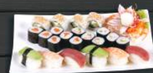
274. SUSHI MENU 4 579 Kč Maki California (6ks) , Nigiri (2ks) , Nigiri Ebi (2ks) Maguro Nigiri (2ks) , Sake Maki (6ks), Buddha Roll (4ks) (A: 2, 4, 6)