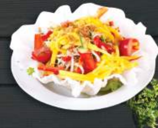
06. SALAD XOÀI XANH VÀ RAU THẬP CẨM 120gr 79 Kč

Zeleninový salát s kuřecím masem ( A: 6 ) Chicken mixed salad