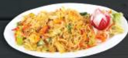
36. BÚN XÀO TÔM GÀ 150gr 169 Kč Smažené tenké rýžové nudle s krevetami a kuřecím masem (A: 2, 3) Fried thin noodle with prawn and chicken