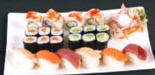
277. SUSHI MENU 7 619 Kč

Sake Nigiri (2ks), Maguro Nigiri (2ks) Ebi Nigiri (2ks) , California Roll (4ks) Sake Maki (6ks) Avosesami Maki (6ks) (A: 2, 4, 6)