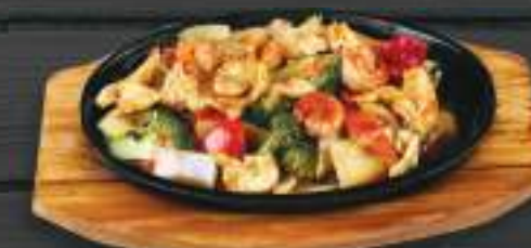
94. TÔM THỊT BÀN GANG 200gr 269 Kč Krevety, kuřecí a vepřové maso se zeleninou a žampiony (A:2) Prawn, chicken meat and pork on sizzling plate with vegetables and champignon