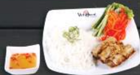
37. BÚN NEM RÁN 3ks 159 Kč Tenké rýžové nudle se závitky a pikantní sladkokyselou omáčkou (A:6) Noodle with fried spring rolls with sweet and sour sauce