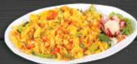
41. CƠM CHIÊN TÔM 169 Kč Gebratene Reismudeln mit Huhn und Gemüse (A:2) Fried rice with prawn