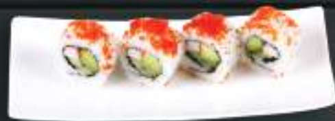
240. CALIFORNIA ROLLS 129 Kč Krab, avokádo, kaviár, sezam (A: 2, 6, 7, 11) Crab, avocado, caviar, sesame