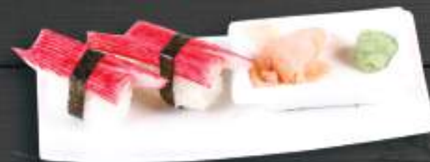
221. SURIMI NIGIRI 2ks 99 Kč Krab (A: 2, 6) Crab