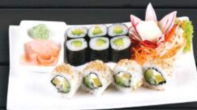
210. AVO SESAME MAKI ( 6KS ) BUDDHA ROLL ( 4KS ) 199 Kč (A: 4,6,7)