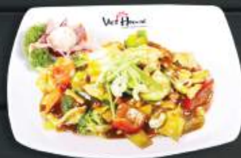
50. GÀ KUNG PAO 150gr 169 Kč Kung Pao (kuřecí maso se zeleninou, a omáčkou Hoisin) (A:6) Chicken Kung Pao