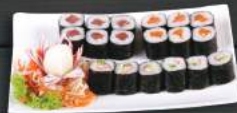
271. SUSHI MENU 1 289 Kč Maki Sake (6 ks), Maki California (6 ks), Maki Tekka (6 ks) (A: 2, 4, 6)