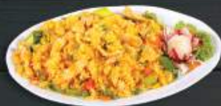
40. CƠM CHIÊN GÀ 150gr 159 Kč Smažená rýže s kuřecím masem a zeleninou (A:3) Chicken fried rice with vegetables