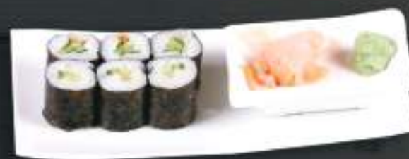
222. CUCUMBER MAKI 2ks 99 Kč Gurke maki Okurka maki