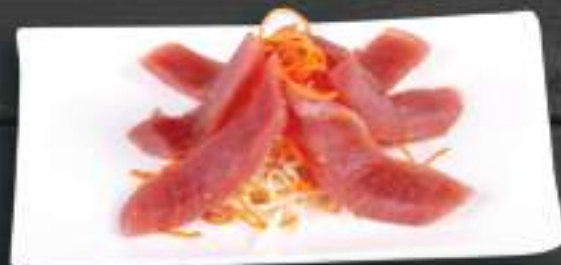
251. MAGURO SASHIMI 6ks 259 Kč Tuňák (A:4) Tuna