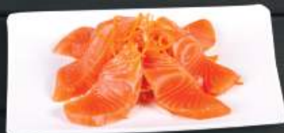
250. SAKE SASHIMI 6ks 229 Kč Losos (A:4) Salmon