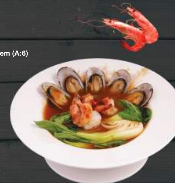
156. UDON 700ml 189 Kč Vařené japonské nudle s mořskými plody (A: 14) Udon with seafood