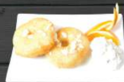
129. DỪA CHIÊN 2ks 69 Kč Smažený ananas v těstíčku s medem a mandlemi (A: 1, 8) Fried pineapple with honey and nuts