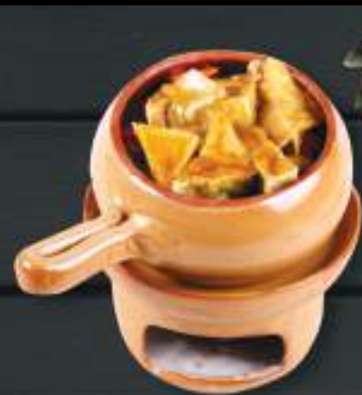
82. ĐẬU PHỤ OM 150gr 249 Kč Smažené tofu v keramickém hrnci se zeleninou a ústřicovou omáčkou (A:14) tofu in ceramic pot with oyster sauce