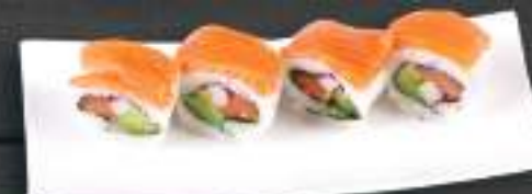
243. RAINBOW ROLL 169 Kč Kreveta, losos, avokádo, okurka (A: 2, 4, 6) Prawn, salmon, avocado, cucumber