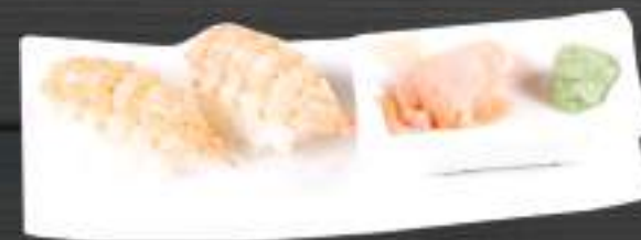
223. EBI NIGIRI 2ks 99 Kč Kreveta (A: 2, 6) Prawn