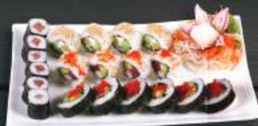
278. SUSHI MENU 8 599 Kč

Sake Nigiri (2ks), Maguro Nigiri (2ks) Ebi Nigiri (2ks) , California Roll (4ks) Sake Maki (6ks) Avosesami Maki (6ks) (A: 2, 4, 6)