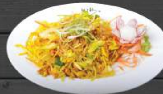
115. MÌ XÀO RAU 250g 119 Kč Smažené nudle se zeleninou (A:3) Fried noodles with vegetables