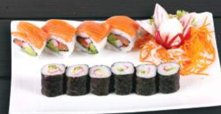
231. RAINBOW ROLL ( 4KS ) 249 Kč CALIFORNIA MAKI ( 6KS ) ( A: 2, 4, 6 )