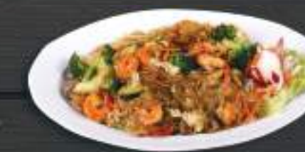
35. MIẾN XÀO TÔM 159 Kč Smažené skleněné nudle s krevetami (A: 2, 3) Fried glass noodle with prawn