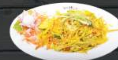
33. MÌ XÀO GÀ 129 Kč Smažené nudle s kuřecím masem (A:3) Fried noodle with chicken