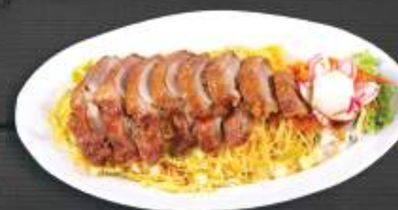
45. BÚN XÀO RAU VỊT 150gr 219 Kč Tenké rýžové nudle s pečeným kachním masem (A:3) Fried glass noodle with duck meat