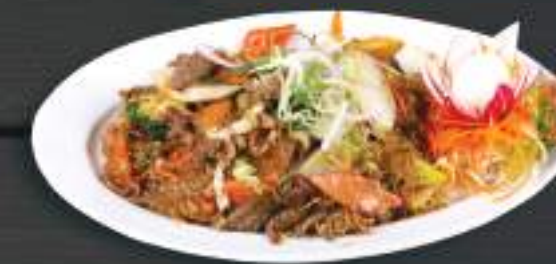
43. MIẾN XÀO BÒ 150gr 169 Kč Smažené skleněné nudle s hovězím masem (A:3) Fried glass noodles with beef meat