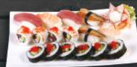
275. SUSHI MENU 5 489 Kč Hot Spicy Tuna Roll (4ks) , Nigiri Unag (2ks) , Futo Maki Sake Avo (6ks) , Maguro Nigiri (2ks), Ebi Nigiri (2ks) (A: 2, 4, 6, 7)