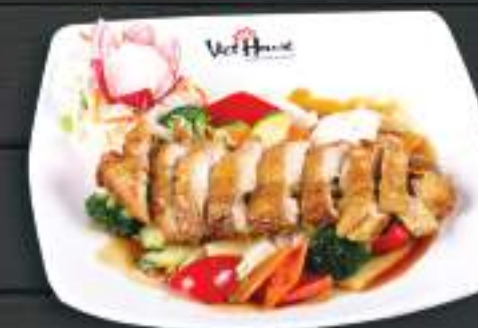
55. GÀ QUAY SÓT DẦU HÀO 150gr 169 Kč Křupavé pečené kuřecí maso s ústřicovou omáčkou (A:6) Crispy chicken meat with oyster sauce