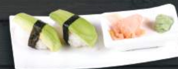
226. AVO NIGIRI 2ks 89 Kč Avokádo (A:6) Avocado