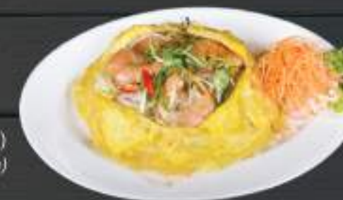
88. PATHAY TÔM 150gr 169 Kč Krevetí Pad Thai: thajské rýžové nudle smažené s vejcem, dochucené pikantní sladko-kyselou omáčkou (A:2) Prawn pad Thai ( Thai fried noodle with prawn and sweet sour sauce)