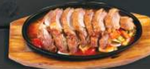
91. VỊT SÁ ÓT BÀN GANG 200gr 269 Kč Pikantní pečená kachna s citronovou trávou (A:6) Grilled duck with spicy lemon grass sauce