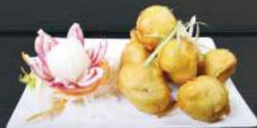
123. HEO CHIÊN GIÒN 150gr 119 Kč Obalované vepřové maso (A: 1) Crispy fried pork meat