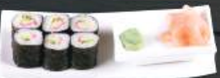
204. CALIFORNIA MAKI 6ks 99 Kč Krab, avokádo (A: 2, 6) Crab and avocado