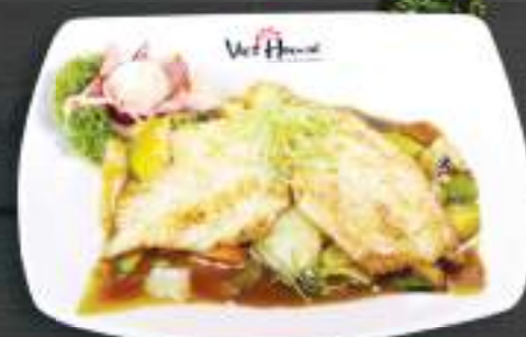
53. GÀ NƯỚNG XÌ DẦU 150gr 169 Kč Grilované kuřecí maso s žampionovo- sojovou omáčkou (A:6) Grilled chicken meat with champignon and soysauce