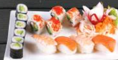
273. SUSHI MENU 3 399 Kč Maki Avo (6 ks), Nigiri Sake (2 ks) Nigiri Ebi (2 ks), Temaki California (4 ks) (A: 2, 4, 6)