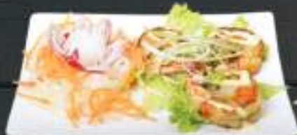
22. TÔM NƯƠNG 129 Kč Grilované krevety (A: 4, 6) Grilled prawn with teriyaki sauce