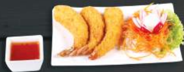
120. TÔM CHIÊN XÙ 89 Kč Smažené obalované krevety, 3 ks (A: 1, 2) Crispy fried prawn