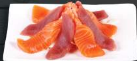
252. VIET HOUSE SASHIMI 329 Kč Sake 4 ks, Maguro 4 ks, Ebi 2 ks (Losos, tuňák, chobotnice, kreveta) (A: 2, 4, 14) Salmon, tuna, prawn, octopus