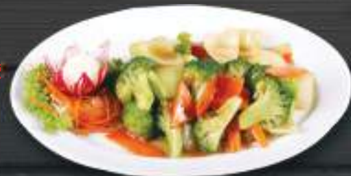
113. BÔNG CẢI XANH XÀO TỎI 200g 119 Kč Restovaná brokolice s česnekem Fried vegetables with garlic