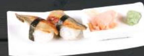
224. UNAGI NIGIRI 2ks 99 Kč Uzený úhoř (A: 4, 6) Eel