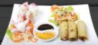
25. KHAI VỊ VIETHOUSE 229 Kč Mix ochutnávka Viet House - velká porce (A: 2, 3, 4, 6, 11) Big Viethouse appetizer plate