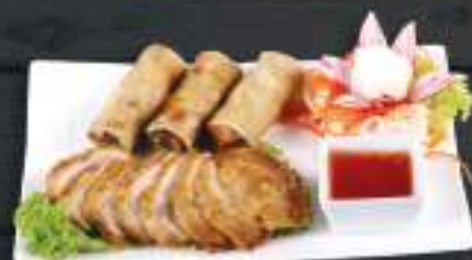
24. KHAI VỊ NHỎ 159 Kč Mix ochutnávka Viet House - malá porce (A: 3, 4, 6, 11) Viethouse Small mix appetizer plate