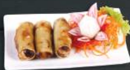
20. NEM RÁN 75 Kč Smažené jarní závitky (vepřové) (A: 3) Fried spring roll (pork)