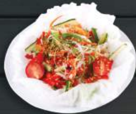
01. SALAD RAU 120gr 59 Kč

Míchaný zeleninový salát Vegetable salad