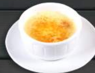
126. BÁNH KEM TRỨNG ĐÓT 120gr 69 Kč Flambovaný creme brulée (A: 7) Creme brulee