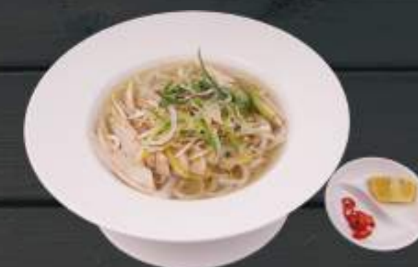
31. PHỞ GÀ 129 Kč Hanojská kuřecí polévka s rýžovými nudlemi Chicken Pho noodle soup