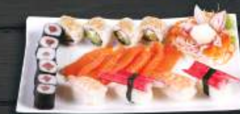
276. SUSHI MENU 6 519 Kč Maki Spicy Tuna (6 ks), Nigiri Kani (2 ks), Buddah rolls (4 ks), Sashimi Sake (6 ks) Ebi Nigiri (2ks) (A: 2, 4, 6)