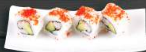
242. EBI TEMPURA ROLL 139 Kč Kreveta, avokádo, okurka, kaviár (A: 2, 6, 7) Prawn, avocado, cucumber, caviar