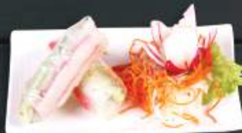
110. NEM CUÓN RAU 69 Kč Letní salátové závitky se zeleninou a vejcem, 2 ks Vegetable spring roll