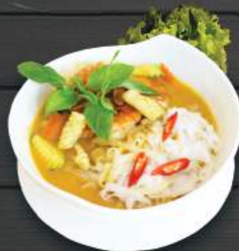
157. PHỞ TRỘN 700ml 169 Kč Varené rýjové nudle na thajském kari s kuřecim/hovězím/mořskými plody (A: 2,14) Thai rice noodle on curry with chicken/beef/seafood